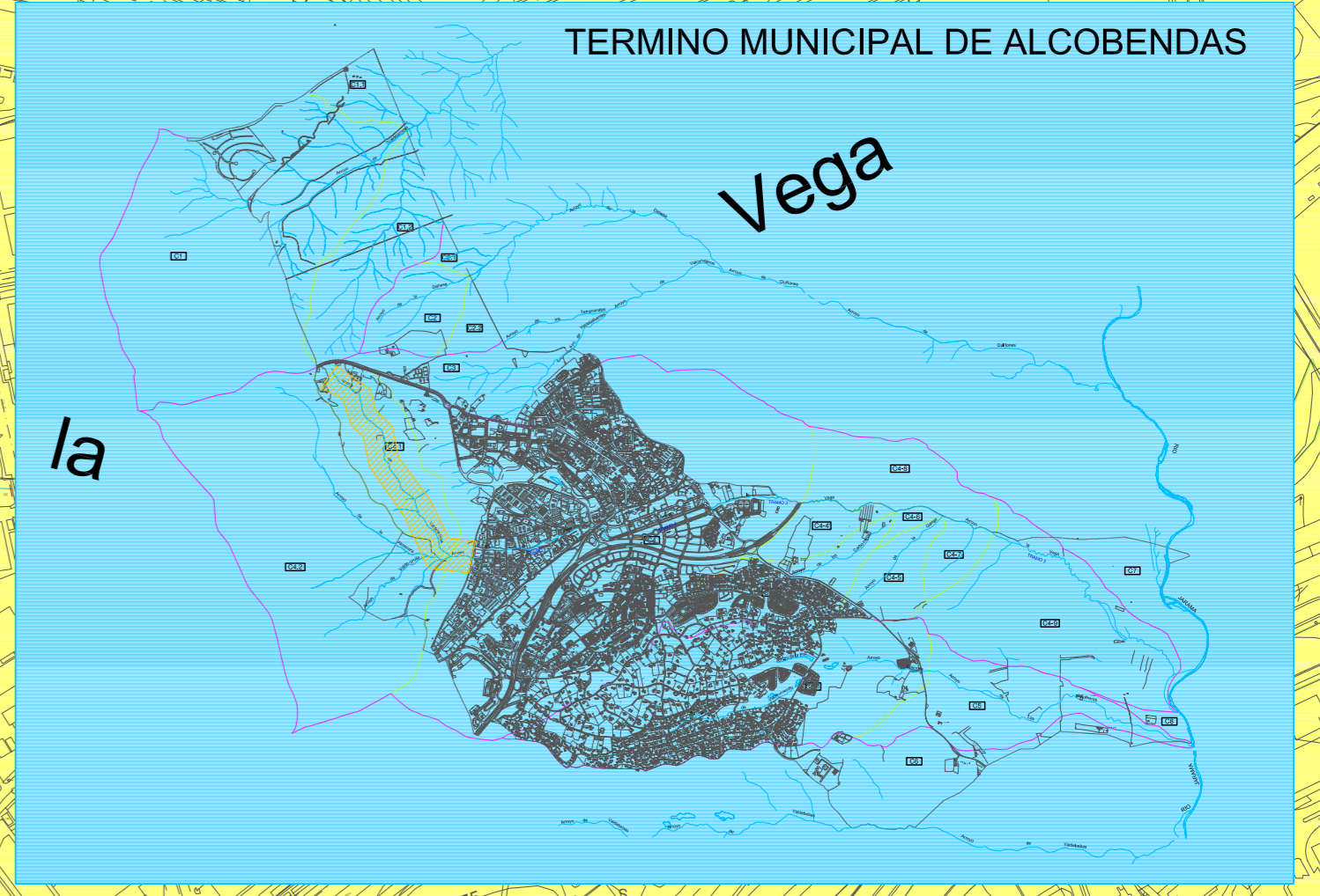
ARROYO DE LA VEGA (TRAMO DE INICIO)