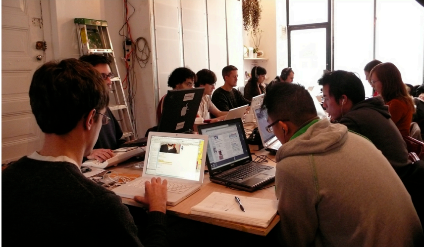
imagen de archivo

El Ayuntamiento de Alcobendas gestionará la utilización de este espacio de emprendimiento y de oficinas para distintos profesionales autónomos y prestará asistencia y asesoramiento y gestores a sus usuarios, incentivando la interconexión y la creación de nuevas oportunidades para todos ellos.