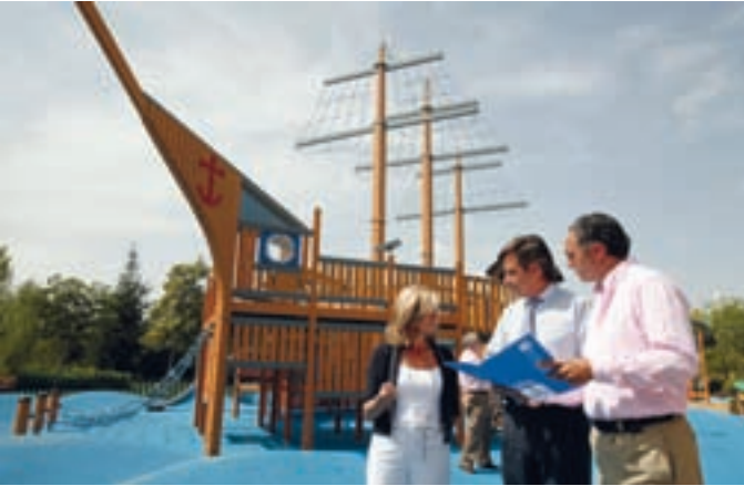
El alcalde ha visitado el área de juegos acompañado de los concejales de Medio Ambiente y Distrito Urbanizaciones.

El gran barco pirata de Arroyo de la Vega recibe todos los días a decenas de niños que disfrutan de lo lindo imaginando grandes aventuras. Se trata de la primera de las áreas infantiles temáticas que el Ayuntamiento tiene previsto instalar en distintas zonas de la ciudad.