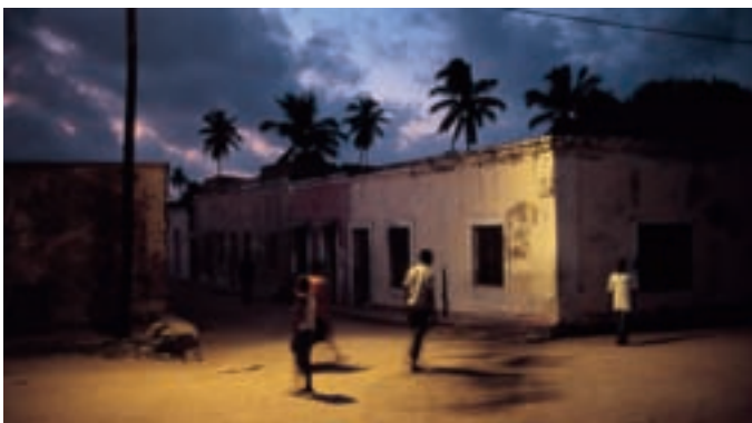
'Isla de Mozambique', de José Manuel Navia.

Dentro de los actos que el Ayuntamiento ha organizado para celebrar el 15º aniversario de la colección de fotografía de Alcobendas, el fotógrafo José Manuel Navia va a impartir un taller en diciembre cuyas inscripciones comienzan el próximo lunes, 27 de octubre.