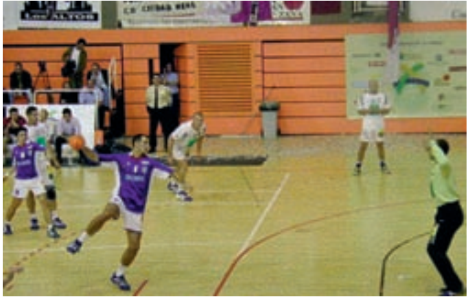
Imagen del encuentro disputado entre ambos equipos en 2004.

Los locales llegan a este partido tras haberse medido a casi todos los favoritos al título y apurados por su situación en la tabla, pero, sobre todo, después de haber realizado un excelente encuentro en el Palau ante el Barcelona, al que pusieron en serios aprie-