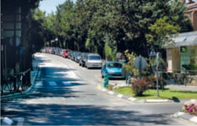
Camino del Soto será una de las calles que se remodelarán.