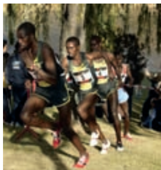
El domingo se disputa el Cross Internacional de la Constitución