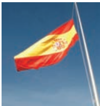
Alcobendas celebra el Día de la Constitución con el izado de la bandera