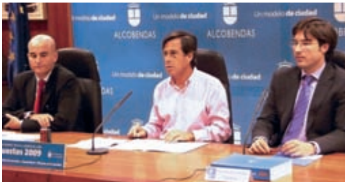
El alcalde junto con el primer teniente de alcalde y el concejal de Economía y Hacienda, en la presentación de los presupuestos a la prensa.

El Pleno municipal ha aprobado los presupuestos del Ayuntamiento de Alcobendas para 2009, que ascienden a más de 304 millones de euros, cifra en la que se incluyen los de los patronatos y las empresas municipales.