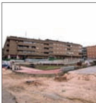
El aparcamiento de la Plaza de Pablo Picasso reanuda su construcción