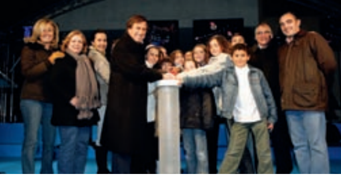
El alcalde y otros miembros del equipo de gobierno, junto con los alumnos de la Escuela de Música y Danza, en el encendido de las luces navideñas.