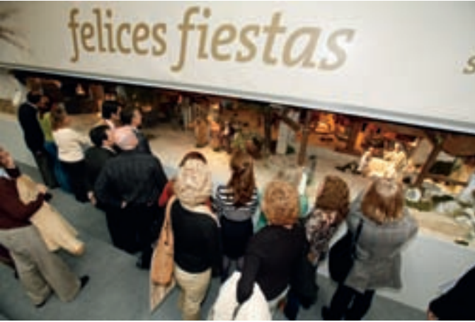
El Belén fue puesto en marcha por el alcalde el jueves 11 de noviembre.

El gran Belén instalado en el Ayuntamiento ya se puede visitar todos los días hasta Reyes. Este año se pretende superar el éxito obtenido en 2007 con un montaje espectacular que representa el nacimiento de Jesús.