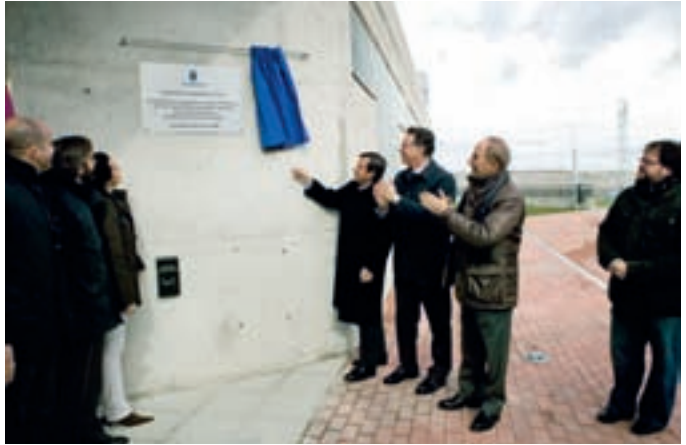
El alcalde de Alcobendas descubrió una placa conmemorativa de la ampliación de la Ciudad Deportiva, junto al consejero de Deportes de la Comunidad, a la derecha

El complejo acuático tiene un diseño vanguardista con la piscina recreativa como eje central; cuenta con toboganes,