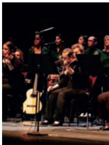
El XVI Concierto para la Paz fue un acto solidario con las actuaciones de objetos donados por destacados vecinos.