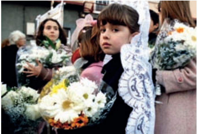
La ofrenda floral a la Virgen se convirtió en un acto en el que numerosas asociaciones de la localidad participaron ofreciéndole flores en su altar. Entre los oferentes, las casas regionales y otras entidades con sus estandartes y banderas. Muchas mujeres lucieron los vistosos trajes de sus regiones.