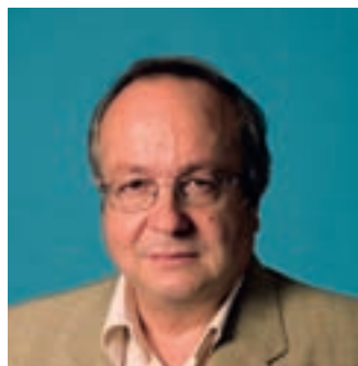
GABRIEL MARTÍNEZ Izquierda Unida

Pero es nuestro patrimonio, es nuestro dinero, que Vinuesa regala y luego nos cobrará a todos con subidas espectaculares de impuestos. Es sólo el principio, hay que pararlo. Anunciamos nuestra impugnación ante los tribunales de justicia.