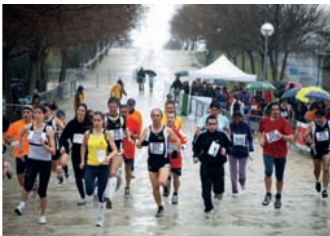
Las actividades deportivas han tenido una gran presencia en la programación con pruebas de disciplinas diversas, entre ellas el atletismo, con el Cross Escolar.