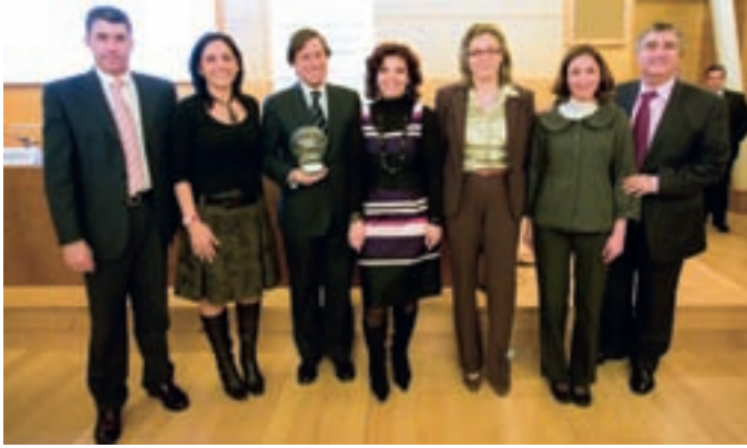
El alcalde y la concejal de Planificación y Organización, junto con su equipo, tras recibir el premio.

El Ayuntamiento de Alcobendas ha recibido el Premio Europeo a las Mejores Prácticas en Protección de Datos por su programa 'Alcobend@s protege tus datos', que adapta desde el año pasado los servicios municipales a la legislación vigente sobre protección de datos de carácter personal.