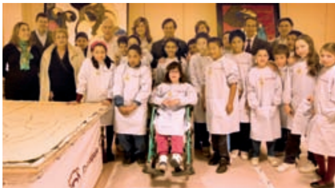
El alcalde y la concejal junto con el artista, los escolares y los profesores.