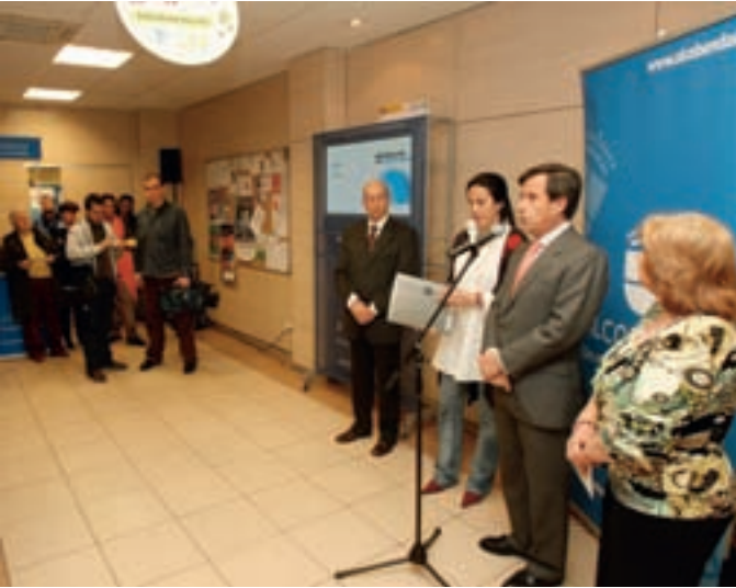
El alcalde, acompañado de las concejales de Obras y Distrito Centro, en la inauguración de la exposición.

La exposición del Plan de Remodelación de nueve calles del Distrito Centro se puede visitar hasta el 23 de marzo en el Centro Cívico de la Plaza del Pueblo. Los vecinos podrán conocer en ella las mejoras que se van a realizar con estas obras que comenzarán en apenas unas semanas y que tienen un plazo de ejecución previsto de seis meses.