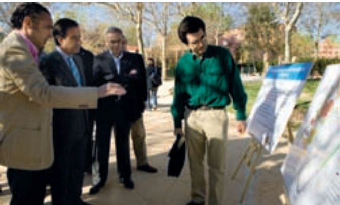
El alcalde ha visitado el parque junto con los concejales implicados en el proyecto.