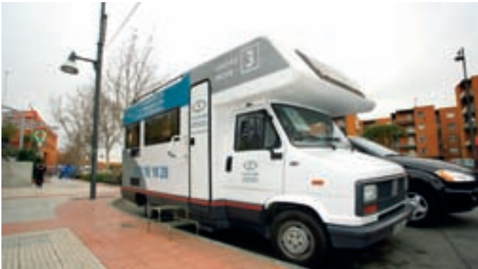
La unidad móvil en la Plaza Mayor durante la campaña del año pasado.

Enfermedades oculares como el glaucoma o las degeneraciones retinianas, entre otras, pueden derivar con el tiempo hacia la ceguera o la fuerte pérdida de visión. Detectar a tiempo determinados problemas oculares es crucial y, por eso, el Ayuntamiento inicia una campaña de prevención.