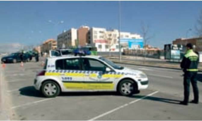
La Policía Local ha intensificado los controles en la calle.

La Policía Local de Alcobendas ha puesto en marcha una campaña de prevención de robos en viviendas. Además de los numerosos controles que realiza en la calle, los agentes municipales aconsejan a los vecinos que adopten unas sencillas normas de seguridad en sus propios domicilios. Con ellas contribuirán a que disminuya la posibilidad de que se produzcan asaltos en el interior de sus casas.