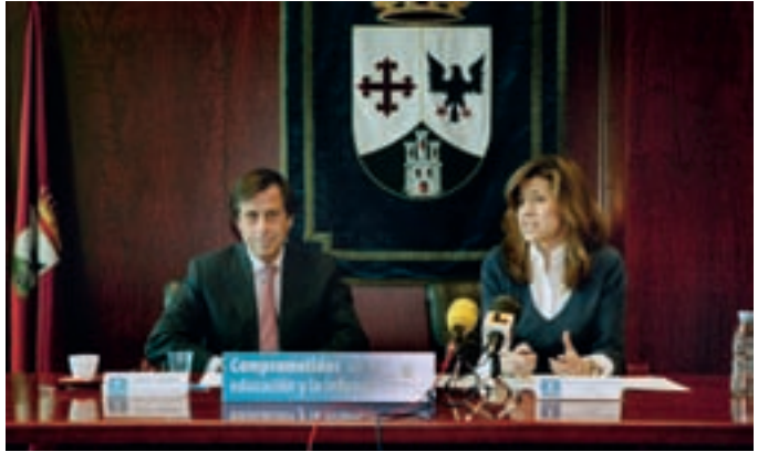
El alcalde y al concejal de Educación en el encuentro con los medios.

Para ayudar a los padres a elegir dónde estudiarán sus hijos,