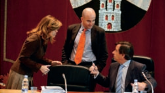
El alcalde, el portavoz popular y la concejal de Educación en el Pleno.

El Pleno municipal celebrado el martes 31 de marzo aprobó la resolución definitiva de la cesión a la Comunidad de Madrid de una parcela para la construcción de un colegio concertado en Fuente Lucha. El acuerdo se llevó a cabo con los votos favorables del Partido Popular.