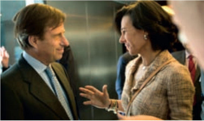
El alcalde conversa con Ana Patricia Botín en un descanso del foro.

El Ayuntamiento de Alcobendas ha participado como socio líder en el XVII Foro del Club Excelencia en Gestión, celebrado bajo el lema 'Innovar en tiempos difíciles. Nuestra apuesta de futuro', al que han acudido políticos, ex ministros y empresarios.