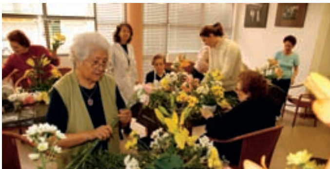
Uno de los talleres que se organizan en los centros de mayores.

Un reciente estudio del Observatorio de la Ciudad sobre los mayores cifra en 10.595 las personas de 65 y más años. Uno de cada cinco vive solo, la mitad dice que goza de buena salud, tan sólo uno de cada cinco necesita ayuda en sus tareas, y conocen muy bien los servicios y prestaciones a los que pueden acceder.