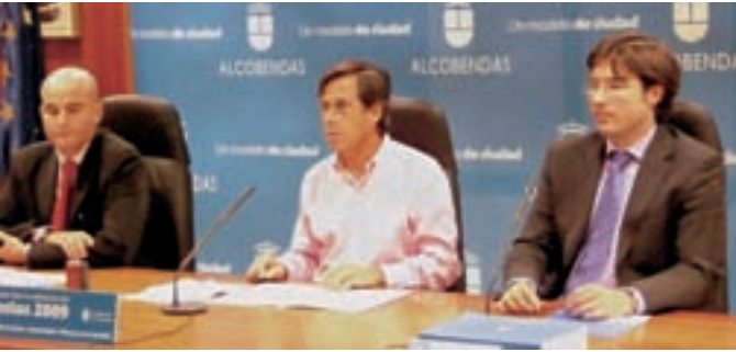
El alcalde, el primer teniente de alcalde y el concejal de Economía en la presentación de los presupuestos de este año, basados en la austeridad.

Alcobendas tiene una deuda de 424,07 euros por habitante, cifra que está por debajo de la media de la Comunidad de Madrid y también de la media nacional. Éste es el dato que figura en el informe hecho público por el Ministerio de Economía y Hacienda sobre la deuda de todas las entidades locales de España.