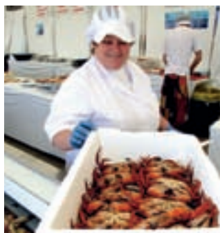
El recinto ferial acoge desde este fin de semana la XIV Semana del Marisco