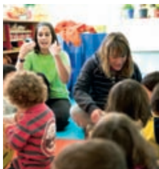
'LaborESO': alumnos de Secundaria viven lo que significa trabajar