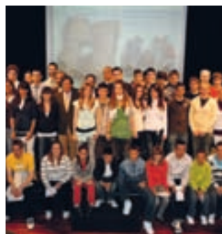
Fundal entrega las becas para asociaciones y deportistas locales