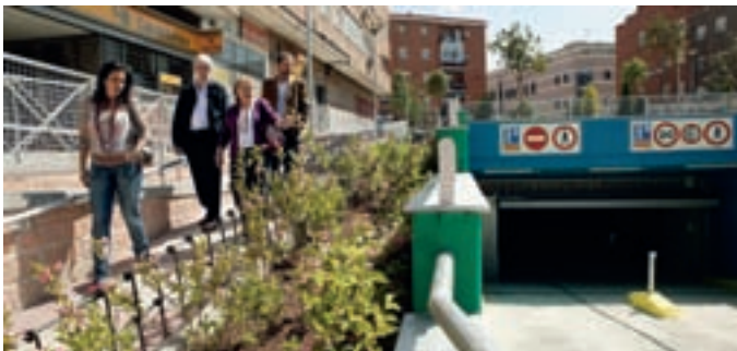
Las concejales de Obras y Distrito Centro en la visita a la plaza.

Tras el final de las obras del aparcamiento para residentes, con capacidad para 320 plazas, los vecinos disfrutan de la nueva Plaza de Pablo Picasso, que dispone de un zona de juego infantil para los más