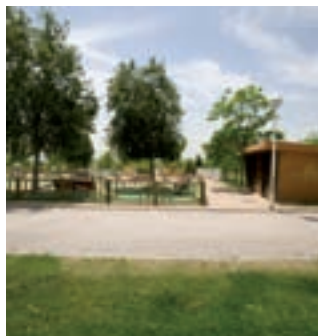
El Parque de Galicia estará remodelado antes del otoño