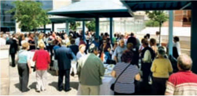
El lunes se inauguró en el Centro de Mayores de la calle Orense una semana llena de actividades.

Alcobendas está en plena celebración de la Semana del Mayor. El alcalde y la concejal de Familia y Bienestar Social dieron el pistoletazo de salida a una semana plena de actividades y pensada para los mayores de Alcobendas, activos y dispuestos a participar en todo cuanto se les propone.