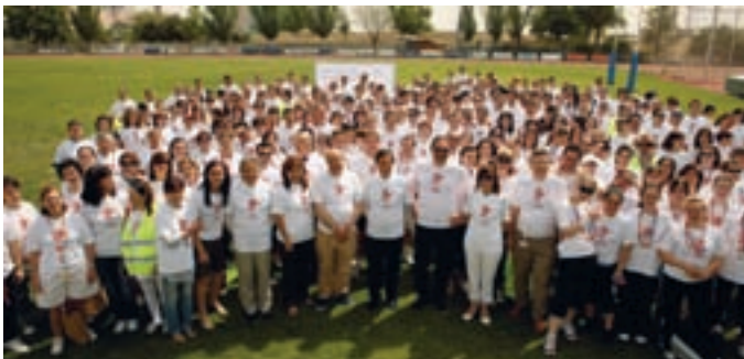
El alcalde y la concejal de Familia y Bienestar Social, en el Día del Voluntariado de Lilly.