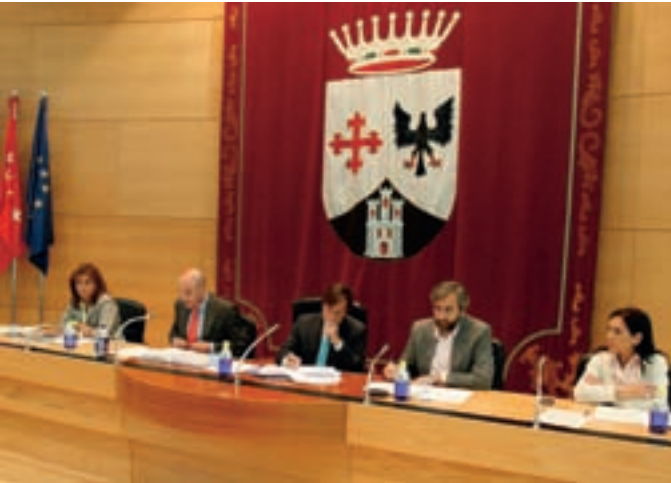
Parte del equipo de gobierno en un momento del Pleno.

El Pleno municipal de Alcobendas ha aprobado el Reglamento del Registro de Familias Numerosas. El objeto de dicho registro es crear una base de datos para regular la concesión de ayudas a las familias numerosas de Alcobendas en las áreas cultural, deportiva, social y de juventud.