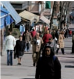
Sondeo de opinión en Alcobendas cerca del ecuador de la legislatura