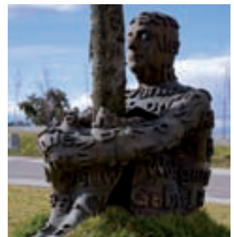
‘El Tren del arte’ enseña a las familias algunas esculturas de la ciudad