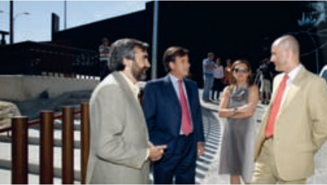
El alcalde y los concejales de Urbanismo y Deportes en el nuevo aparcamiento.

Desde el pasado miércoles, 3 de junio, los usuarios del polideportivo municipal pueden utilizar el nuevo aparcamiento situado junto a la que se ha convertido en la entrada principal al recinto.