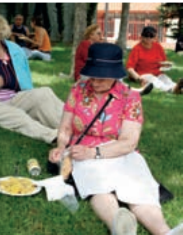
En el Parque de la Comunidad de Madrid, los mayores y sus familias y degustaron juntos una gran paella.

da su niñez: “Los de nuestra época no hemos tenido niñez...”. Envió estando embarazada de su segundo hijo y tuvo que sacarlos adelante cosiendo todo el día. Los malos recuerdos, sin embargo, se olvidan cuando piensa que la vida le ha sonreído con lo más grande: “mis dos hijos, que están siempre conmigo, el resto de mi familia y toda la gente que he conocido”. El broche de oro a la Semana del Mayor fue la jornada de convivencia que se celebró en el Parque de la Comunidad de Madrid y en la que los mayores tuvieron la oportunidad de compartir diversión y paella no sólo con sus amigos, sino también con su familia.