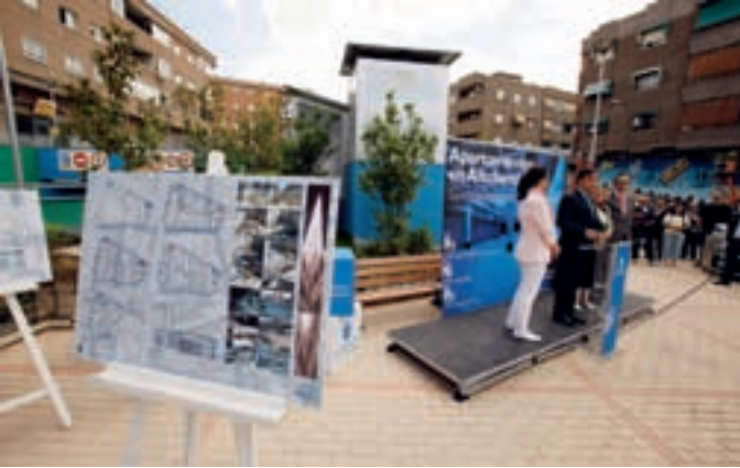
El alcalde, junto a los concejales de Obras Municipales, Medio Ambiente y Distrito Centro, en la inauguración del aparcamiento.

Tras dos años de trabajo y conversaciones tanto con los propietarios de plazas como con la empresa adjudicataria, el pasado martes 9 de junio se inauguraba el aparcamiento Pablo Picasso con 320 plazas para residentes, el más moderno, novedoso y cómodo de los estacionamientos municipales.