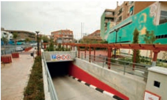
El aparcamiento Julián Baena de Castro es uno de los que se verán beneficiados con la rebaja en el abono mensual.

Asimismo, ya ha comenzado la comercialización de abonos mensuales renovables en el nuevo aparcamiento Pablo Picasso, inaugurado esta semana, también al precio de 80,91 euros con IVA.