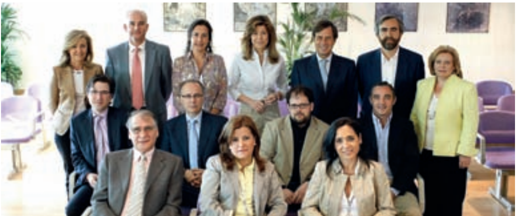
El equipo de Gobierno.