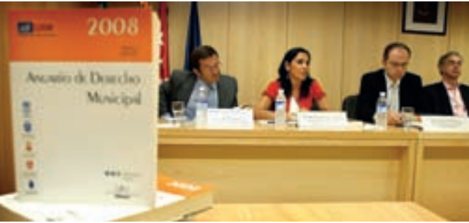
La concejal de Planificación en la presentación del anuario.

El Ayuntamiento de Alcobendas ha participado en la elaboración del 'Anuario de Derecho Municipal', que publica el Instituto de Derecho Local de la Universidad Autónoma de Madrid en colaboración también con los ayuntamientos de Madrid, Tres Cantos, Majadahonda y San Sebastián de los Reyes.