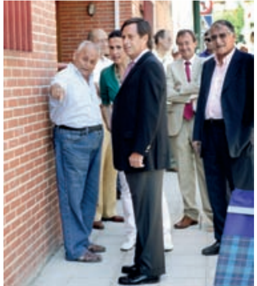
Los vecinos hablan con el alcalde, la concejal de Obras y el presidente del Distrito sobre la remodelación.