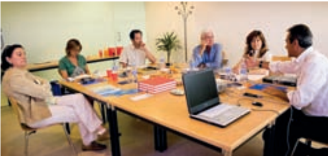
El jurado, deliberando el pasado 25 de junio sobre las candidaturas.

La entrega del Premio Internacional de Fotografía Alcobendas , que contará con la presencia del autor, se realizará el próximo otoño, coincidiendo con el Día Internacional de la Infancia.