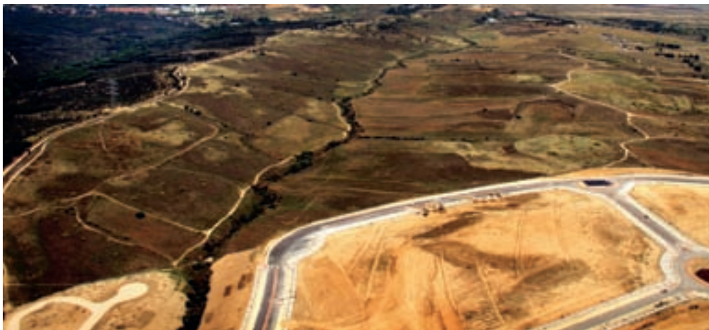
Los Carriles se convierten en zona residencial en este Plan General.

El Consejo de Gobierno de la Comunidad de Madrid ha aprobado el Plan General de Alcobendas. De este modo, el Ejecutivo regional da luz verde al modelo de ciudad que contempla la construcción de 8.600 nuevos pisos, la mitad de los cuales deberán ser protegidos.