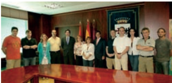
El alcalde y el concejal de Recursos Humanos junto a los representantes sindicales en la firma del convenio.

El alcalde de Alcobendas, Ignacio García de Vinuesa, y representantes de los sindicatos CC.OO., CSI-CSIF y CGT firmaron el viernes 3 de julio el convenio colectivo de los trabajadores del Ayuntamiento de Alcobendas y de sus patronatos para el periodo 2008-2011. Por