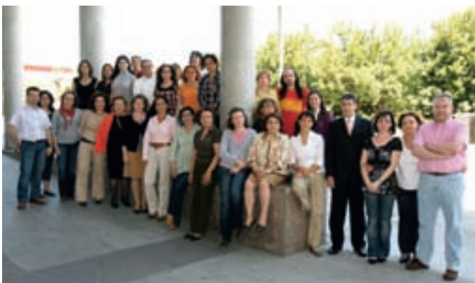
La concejal de Planificación y Calidad junto con el equipo del SAC.

El Ayuntamiento de Alcobendas ha iniciado un proceso de renovación de los compromisos de servicio con los ciudadanos. El primero en abordarse es el correspondiente al Servicio de Atención Ciudadana (SAC), por ser el que da la respuesta más inmediata a las demandas de los vecinos.