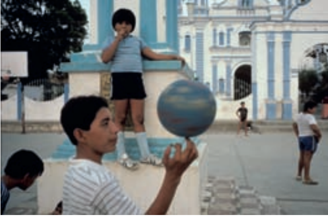
La fotografía ganadora: ‘México 1985. Niños jugando en un patio’.

El fotógrafo americano Alex Webb ha sido galardonado con el ‘Premio Internacional de Fotografía Alcobendas’, en su primera edición. El jurado ha reconocido la presencia delicada e intensa de la infancia en todos sus trabajos.