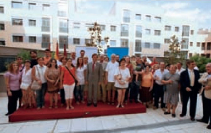
El alcalde, el concejal de Vivienda y el presidente del Distrito Norte con los adjudicatarios.

Esta semana, los futuros vecinos de Fantasía, 3 y de Sonrisa, 12 en la urbanización Fuente Lucha han celebrado la finalización de las obras de sus viviendas de protección construidas por Emvialsa.