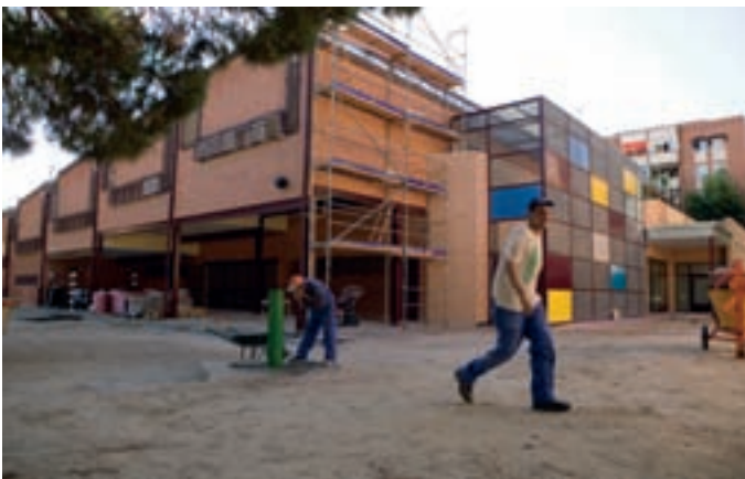
CEIP Antonio Machado.

En el colegio Antonio Machado se completará este verano la rehabilitación del centro, ya iniciada el año pasado, con nuevos pavimentos, la renovación de las acometidas, alumbrado exterior y pistas deportivas, la sustitución de la carpintería de metal por otra de aluminio en la fachada, la plantación de nuevos árboles y la instalación de un nuevo sistema de megafonía y detectores ópticos en la instalación