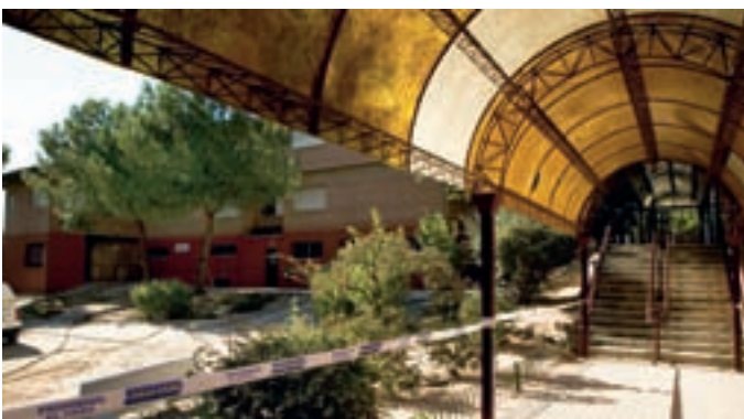
CEIP Miguel Hernández.

El Ayuntamiento de Alcobendas invertirá este año 4.239.867 euros en el Plan de Mejoras en los Colegios Públicos, la gran mayoría durante el verano, en una serie de necesidades planteadas por los directores y las AMPA con el fin de modernizar las instalaciones y mejorar la calidad de la educación pública.