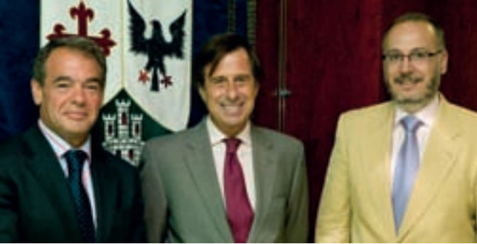
El alcalde y el concejal de Seguridad Ciudadana junto al director general de Bilbomática.

El Ayuntamiento de Alcobendas ha suscrito con la empresa Bilbomática un convenio para la implantación del sistema de gestión de la seguridad, denominado Gespol VI, un software informático que facilitará el trabajo de la Policía Local.