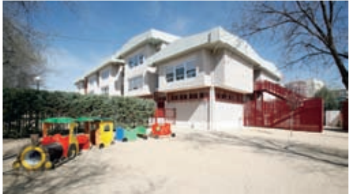
CEIP Emilio Casado.

contra incendios. También finalizará este verano la reforma integral del colegio Emilio Casado con la modernización de la cocina y los aseos del pabellón de servicios y gimnasio, la mejora de la accesibilidad entre los distintos edificios mediante rampas, la renovación de la instalación eléctrica y el sistema contra incendios, la rehabilitación de la cubierta y la ampliación del sistema de megafonía.