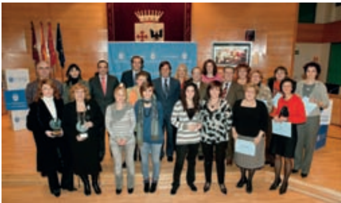
El delegado de la Cámara de Comercio, el presidente de AICA, el concejal de Comercio y el alcalde entregaron los premios.

El día 3 de enero se entregaron los premios del XX Concurso de Escaparates de Alcobendas, organizado por la Cámara Oficial de Comercio e Industria de Madrid, la Asociación de Empresarios de Alcobendas (AICA) y el Ayuntamiento de Alcobendas. El acto se celebró en el salón