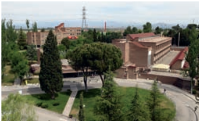
Las actuales instalaciones de la Universidad de Comillas en Alcobendas.

Con la aprobación de otras mociones, el Pleno ha mostrado su rechazo al anuncio del Gobierno de la nación de congelar las pensiones y a favor de crear un nuevo modelo de financiación local.