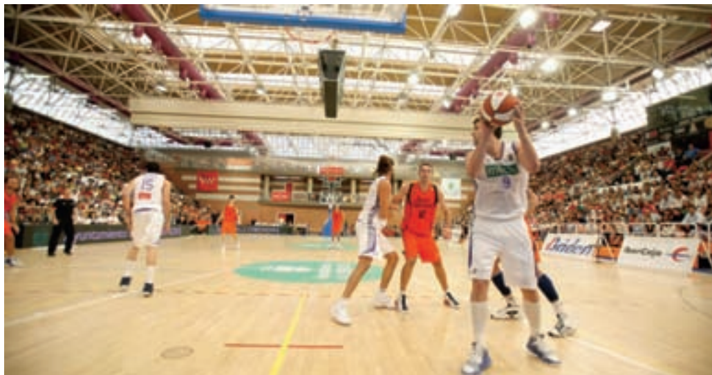
El pabellón B registró un lleno absoluto en los tres partidos y ofreció una imagen excelente.