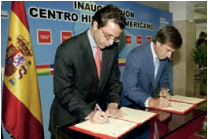
De izquierda a derecha, el consejero de Inmigración y Cooperación, Javier Fernández-Lasquetty, y el alcalde, Ignacio García de Vinuesa, rubricando el convenio.

a desarrollar, está el Taller de Acogida , la creación de un espacio de encuentro entre mujeres autóctonas e inmigrantes, el asesoramiento sobre regularización e inserción laboral, cursos de español para inmigrantes, etc.