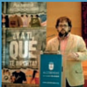
Presentado el 'Plan Juventud Alcobendas 2020'