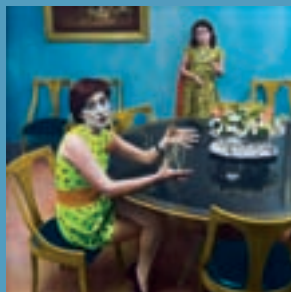
'Humanos...', en el Centro de Arte Alcobendas