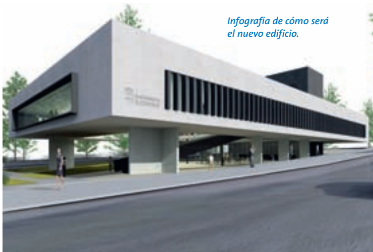
Infografía de cómo será el nuevo edificio.

trata de una construcción singular, cuyo volumen es abierto hacia todas las direcciones con el objeto de invitar a los vecinos a entrar en él y a que lo consideren un centro de encuentro y representativo de la ciudad. Se construirá en Fuente Lucha, en la confluencia de la Avenida de Pablo Iglesias con la calle de la Felicidad; y tendrá alrededor de 4.500 metros cuadrados y un presupuesto estimado de cinco millones de euros.