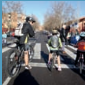
El domingo, 'Muévete en bici' en el Bulevar Salvador Allende