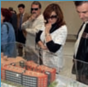
Registro municipal de solicitantes de viviendas protegidas