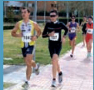
Campeonato de España contrarreloj por equipos de duatlón