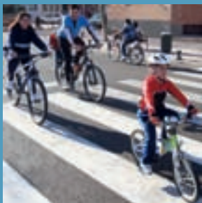
Alcobendas celebra la 'Semana de la Bicicleta'