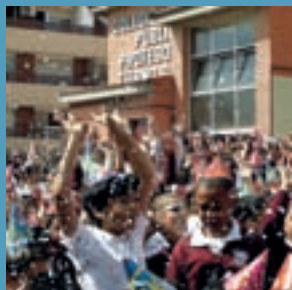
El colegio Tierno Galván festeja su 25º aniversario