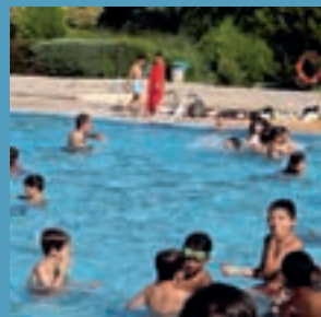
Este sábado se abre la piscina de verano del polideportivo