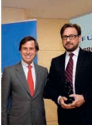
En la imagen de la izquierda, el concejal de Deportes, y en la de la derecha, el alcalde con uno de los premiados.

La Fundación Deporte Alcobendas entregó el 5 de febrero los primeros Premios a la responsabilidad social y empresarial . Se trata de reconocer el trabajo en asuntos como el desarrollo sostenible, la salud para mayores, la inmigración o el trabajo en favor de la infancia, que concuerdan con los programas sociales impulsados