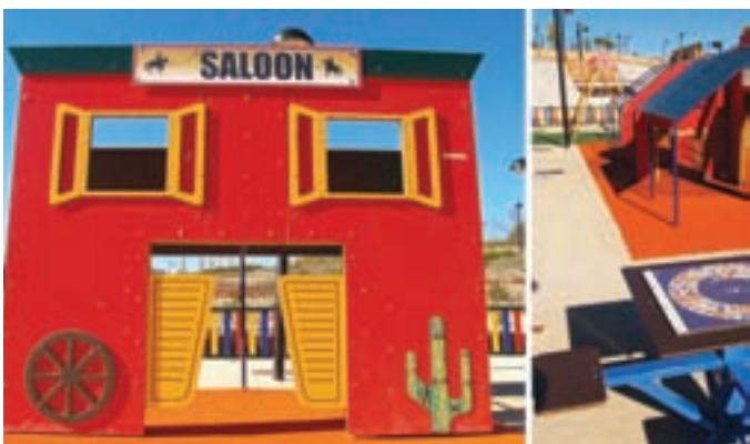
Arriba, nuevos juegos infantiles instalados en el Parque de Castilla-La Mancha. Debajo, área temática del Oeste ubicada en el nuevo desarrollo de Fuente Lucha.

El Plan de Mejora de las Áreas Infantiles en los parques públicos contempla la puesta en marcha de un mantenimiento preventivo que permita conservar en buen estado los juegos para niños y eliminar aquellos elementos que pudieran resultar peligrosos. Para ello, el Ayuntamiento está empleando los recursos