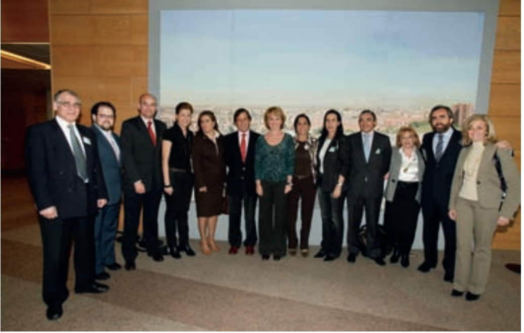
La presidenta de la Comunidad de Madrid con parte del equipo de gobierno municipal.

proximidad a los vecinos y hay una mayor transparencia en la gestión.