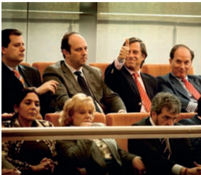
El alcalde de Alcobendas, junto al de Pozuelo y Torrejón, muestra su alegría durante el acto celebrado en la Asamblea de Madrid.

La pertenencia al grupo de municipios de gran población conlleva una serie de ventajas, pues Alcobendas contará con un nuevo régimen jurídico que permitE modernizar la Administración, agilizando y simplificando su gestión. Facilita la toma de decisiones políticas y la gestión administrativa, aumenta la participación ciudadana, permite una mayor