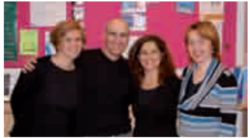
Miembros del equipo de la Oficina de Información Juvenil de Imagina.

Si eres joven, reivindica con nosotros que "la información es un derecho". Podrás hacerlo a través del concurso Info-Haikus: Juventud-Información . El haiku es un poema que describe generalmente los fenómenos naturales, el cambio de las estaciones y la vida cotidiana de la gente. Su estilo se caracteriza por la naturalidad, la sencillez, la sutileza, la austeridad o la aparente asimetría que sugiere la libertad. Envía un haiku incluyendo las palabras 'Joven-