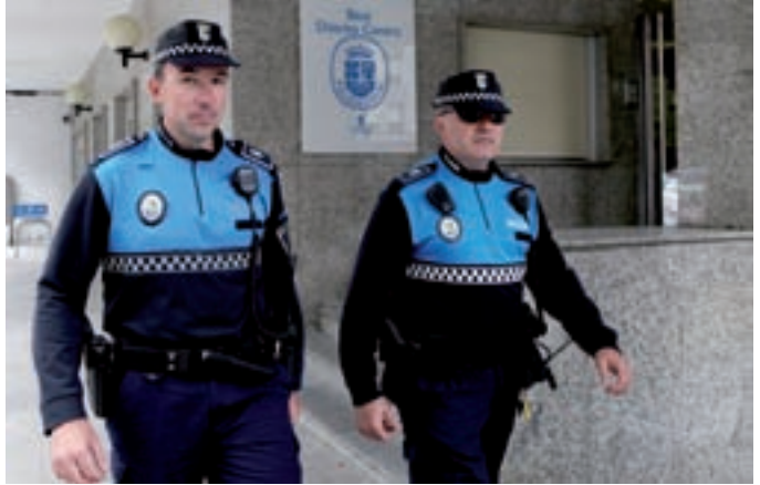
El Plan de Seguridad contempla el aumento de la presencia de agentes de la Policía Local en las calles.

Los vecinos que vayan a disfrutar de unos días de descanso pueden hacerlo más tranquilos gracias al programa 'Seguridad en Vacaciones' que el Ayuntamiento de Alcobendas pone en marcha a través de la Concejalía de Seguridad Ciudadana, Tráfico y Protección Civil. Para ello, tan sólo es preciso facilitar los datos personales y cómo ser localizados en caso de algún problema en su domicilio. Los