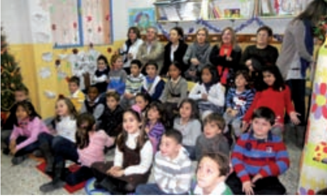
Los alumnos de 2º de Primaria del colegio San Antonio, ganadores del concurso.

El colegio San Antonio de Alcobendas pondrá su nombre a una nueva ludoteca que estará en Haití y que podrá construirse gracias a la Campaña Un Juguete, Una Ilusión , que organizan Radio Nacional de España y la Fundación Crecer Jugando y que preside la Infanta Doña Elena. Los alumnos de 2º de Primaria del colegio San Antonio fueron los ganadores de la VII edición del Concurso de Cuentos Solidarios que se enmarca en la misma campaña solidaria. El premio por ganar el concurso es, precisamente, que la nueva ludoteca lleve el nombre del centro escolar. La ludoteca se instalará en