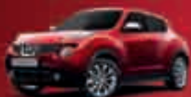
NISSAN JUKE 1.6i 117 CV ACENTA e-POWER 14.950€