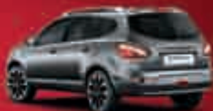
NISSAN QASHQAI+2 1.6i 117 CV ACENTA Stop&Start 7 PLAZAS e-POWER 19.200€