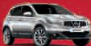
NISSAN QASHQAI 1.6i 117 CV ACENTA Stop&Start e-POWER 17.100€