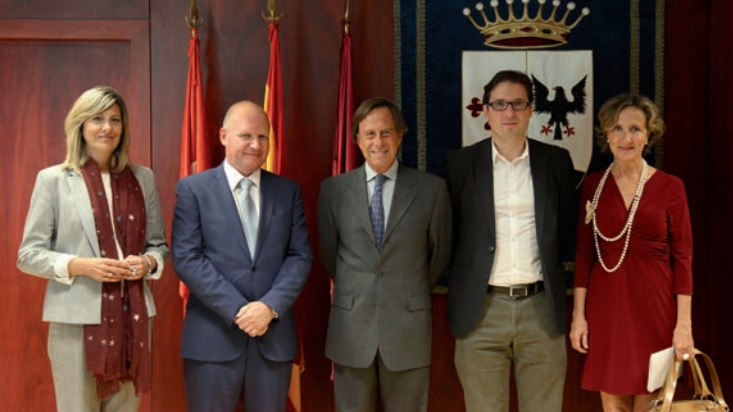
El alcalde de Alcobendas, Ignacio García de Vinuesa, y el presidente de Asociación Española de Centros de Negocios, Eduardo Salamendi, firmaron el convenio de colaboración.

NUEVAS OPORTUNIDADES | El objetivo es fomentar la permanencia de los emprendedores en nuestra ciudad