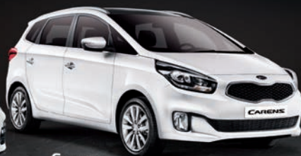
Carens desde 15.600€