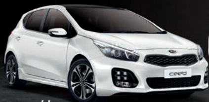
Gama cee'd desde 11.750€