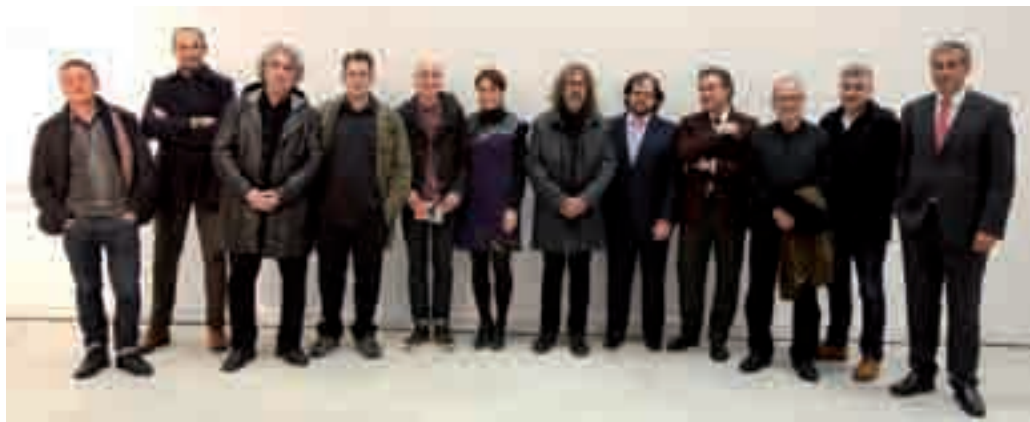
Una representación de los fotógrafos con obra en la Colección Alcobendas y que forman parte de las últimas adquisiciones.