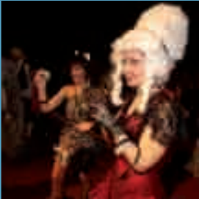
Bailes de máscaras y disfraces para comenzar el carnaval