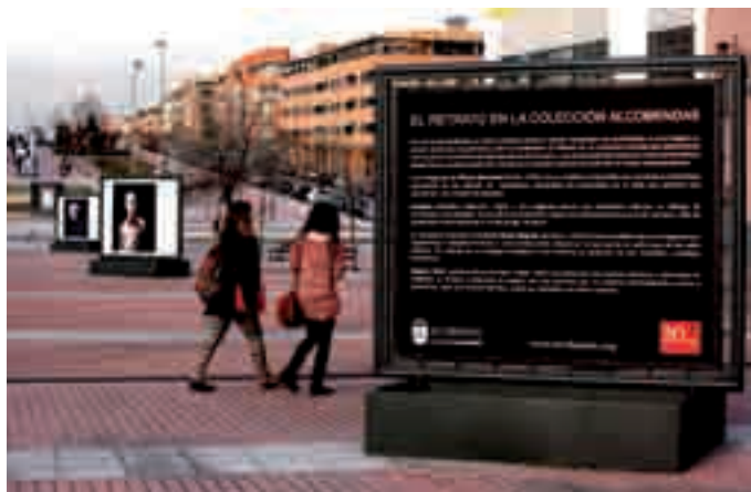
El Paseo de Valde lasfuentes es otro de los puntos de ciudad donde se muestra parte de la Colección para celebrar su aniversario.