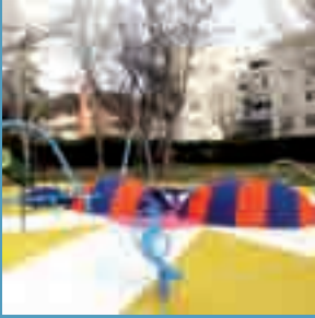
El Parque Asturias-Cantabria estrena nueva zona de juegos