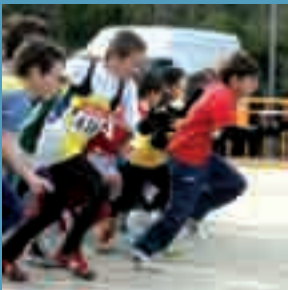
El domingo se disputa el Cross Escolar en el Parque de Andalucía