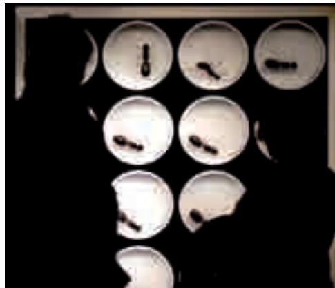
En la imagen de la izquierda, la exposición 'Nuevas adquisiciones 2009-2012', en la Fundación Metròpoli. En la de la derecha, la muestra 'Fotografía... ¿Arte o Ciencia?', en CosmoCaixa. Ambas se pueden ver hasta el 17 de marzo.