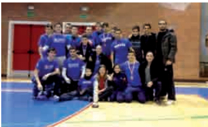
Tercer triunfo consecutivo del equipo del Han Kuk en el campeonato de Madrid.