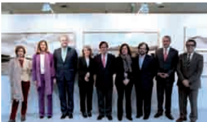
El alcalde y el concejal de Cultura, junto a varias personalidades del mundo de la fotografía, en el acto central del 'XX Aniversario de la Colección Alcobendas'.

“Creo que el mundo sin la imagen fotográfica sería más pequeño”, dijo Alberto Shommer en su discurso como académico electo de la Real Academia de Bellas Artes de San Fernando. Una frase muy apropiada para rescatar en estos momentos, en los que Alcobendas, Gran Ciudad, celebra el XX Aniversario de la Colección Alcobendas de Fotografía , que alcanza ya las 800 obras de 148 autores españoles contemporáneos. “Es la mejor ocasión para volver a mostrar esta joya, patrimonio de nuestra ciudad, y compartirla con los vecinos, que han convertido a Alcobendas en referente cultural. Ninguna otra institución pública de nuestro país tiene una colección de estas características por su dimensión y por la importancia de los autores de las piezas adquiridas”, dijo el alcalde, Ignacio García de Vinuesa, en la inauguración de la exposición ubicada en el Patio de Encuentros del Ayuntamiento, la octava que se presenta en las últimas semanas en Alcobendas. Y nos atre-