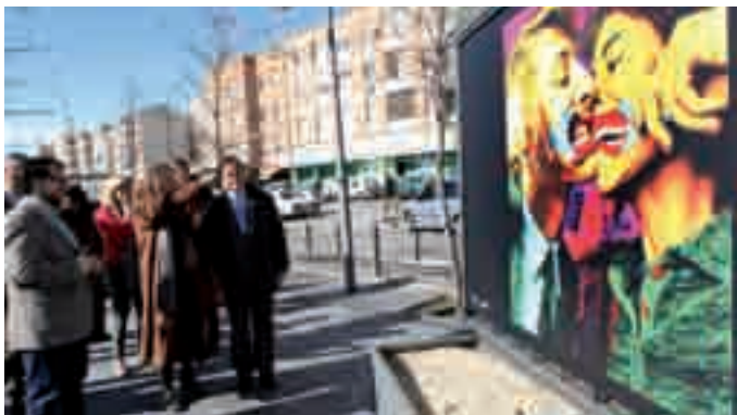
La fotógrafa Ouka Lee y el alcalde de Alcobendas, en la inauguración de la exposición del Bulevar Salvador Allende.