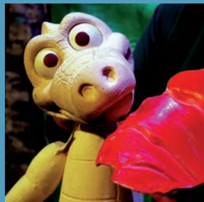
Este fin de semana termina la XXIV Muestra de Títeres