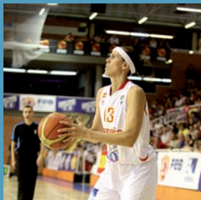
Amaya Valdemoro, nombrada Hija Predilecta de la Ciudad