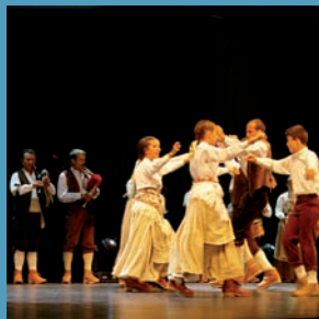
La Xuntanza nos invita a celebrar el Día de Galicia