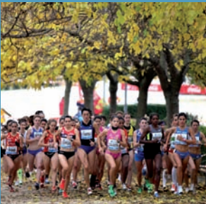
Este domingo, Cross Internacional de la Constitución