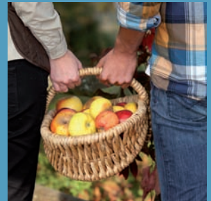
Alcobendas pone en marcha los huertos urbanos