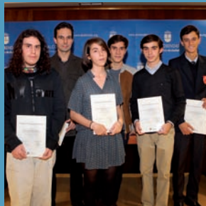
Seis alumnos reconocidos por sus premios educativos