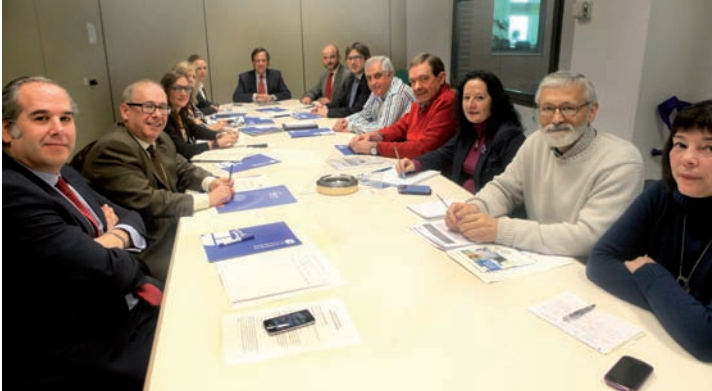
Representantes del Ayuntamiento, AICA, CCOO y UGT, miembros del Pacto Local por el Empleo, durante la reunión del Consejo General.