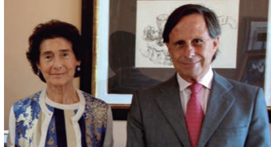
El alcalde y la presidenta de la Escuela de Música Reina Sofía firmaron el convenio el lunes 18 de septiembre.

El primer concierto didáctico será en diciembre con el título La vuelta al mundo en 8 melodías , basado en el libro de Verne. En febrero, Aires tropicales , con un quinteto de viento de la Escuela de Música Reina Sofía tocando ritmos de la música cubana. Y en marzo, Pedro y el lobo , un concierto para los más pequeños con piezas clave de la música descriptiva. De cada concierto se han pro-