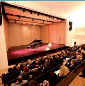
El Auditorio del Centro de Arte Alcobendas se llamará 'Paco de Lucía'