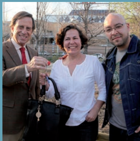
Entregados los primeros huertos urbanos familiares