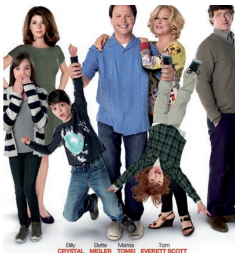
Billy Crystal Bette Midler Marisa Tomei Tom Everett Scott

Con el fin de ampliar el número de películas y de días de diversión, Cine de Verano tendrá una sesión más: será la del 5 de septiembre, día en que se proyectará la película Los becarios . Se trata de una divertida comedia que cuenta la historia de Billy y Nick, dos comerciales que acaban de perder su empleo y que llegan a la conclusión de que su problema consiste en no haberse adaptado a las nuevas tecnologías.