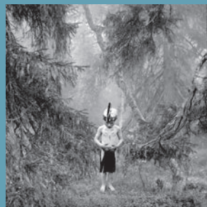
Exposición 'El bosque dorado', en el Centro de Arte Alcobendas