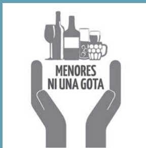
En la 'Red de Ciudades contra el Consumo de Alcohol por Menores'