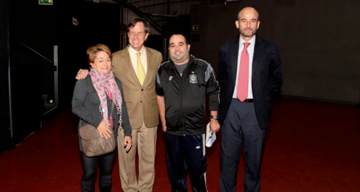
Óscar y su madre posan junto al alcalde y el concejal de Urbanismo tras el sorteo de las viviendas.

VIVIENDA | El plazo previsto de entrega es a finales de 2016