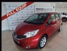
NISSAN NOTE 5P. 1.2G 80CV TEKNA SPORT

kilometraje: 28.195 Km Matriculación: 11 / 2013