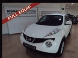
NISSAN JUKE 1.6 TEKNA PREMIUM 4X2

kilometraje: 54.391 Km Matriculación: 9 / 2011