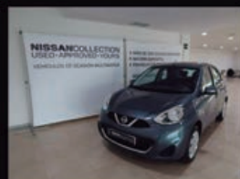
NISSAN MICRA 5P 1.2G (80CV) ACENTA

kilometraje: 7.700 Km Matriculación: 3 / 2014