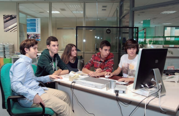
Los alumnos, durante un momento de sus prácticas.

FORMACIÓN | Experiencia '4 º eso+empresa'