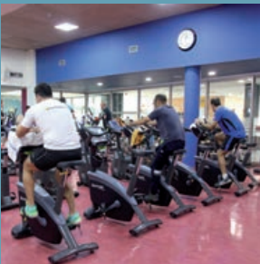
Mejoras en las instalaciones deportivas municipales