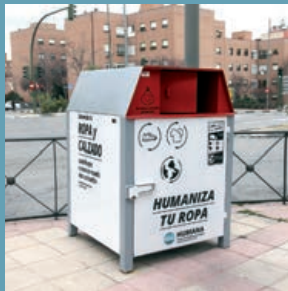
Alcobendas recibe el ‘Premio Humana de Reutilización Textil’