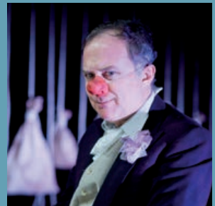
Con ‘El minuto del payaso’ comienza el programa ‘Puro Teatro’