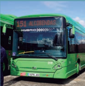
Autobuses híbridos para la flota de Interbús de Alcobendas