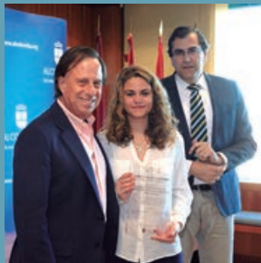
Reconocimiento a alumnos excelentes de ESO y Bachillerato