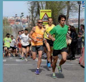
El viernes 11 se celebra el Cross Aldovea Fundación ProNiño