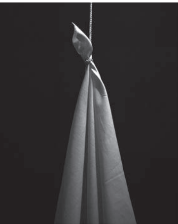
‘Mangrovines’, 2016, de Jonas Forchini..

julio, en el Centro Cultural Anabel Segura, su trabajo en Confines .