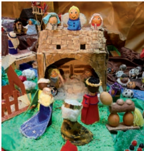
El colegio Parque de Cataluña consiguió el año pasado el premio al Belén más ecológico.

Ha comenzado diciembre y los escolares tienen su mirada puesta ya en las vacaciones de Navidad, pero, mientras llegan, en muchos colegios de Alcobendas ya se divierten adornándolos, cantando villancicos y preparando el belén para participar en el concurso que convoca el Ayuntamiento y en el que se valora la participación de los alumnos, la originalidad, la calidad estética y la dificultad técnica. Se han establecido tres premios: al Belén más creativo ,