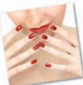
salud y belleza