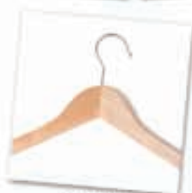
moda y complementos