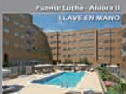
Fuente Lucha - Alabra II LLAVE EN MANO